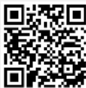
คู่มือการใช้งาน e-Voting