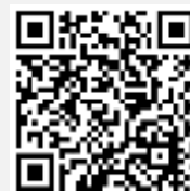
วิดีโอการใช้งานระบบ Inventech Connect